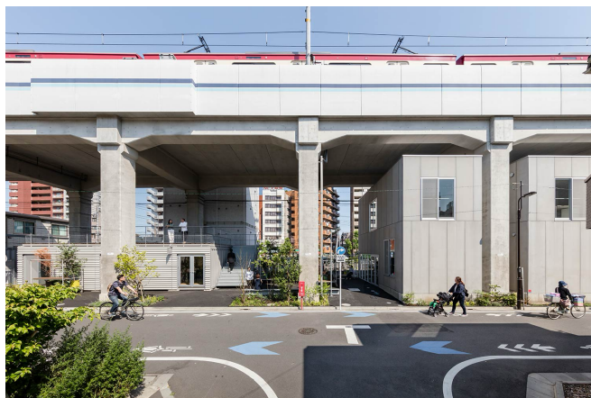
拠点となるものづくりをテーマとしたインキュベーションスペース KOCA

@カマタは、不動産、建築、アート、デザイン、プロダクトなどを専門とするプレイヤーによって構成されています。業務やプロジェクトに応じて最適なチームをつくり、様々な主体とコラボレーションしながら目的を達成していきます。